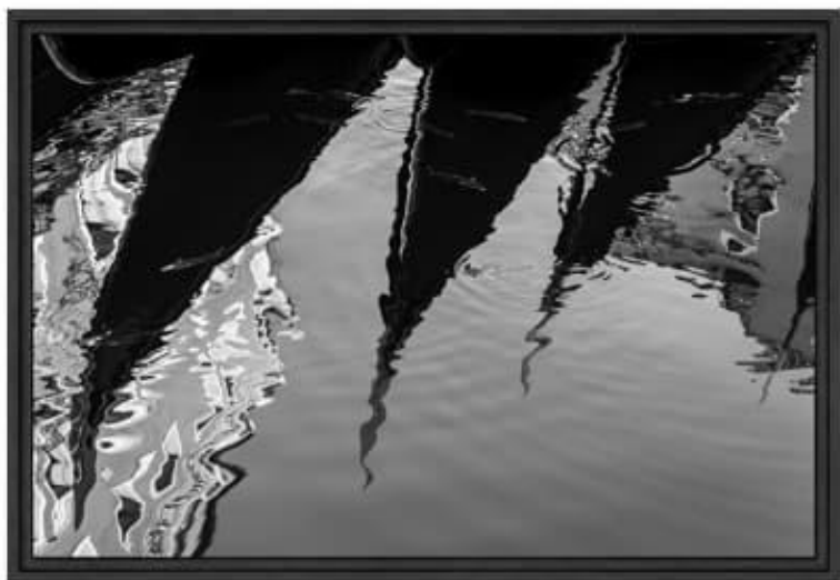
Récupération / Recovery, 2021 90 x 60 cm ed. 1/10 + 2 AP

"Eva Vasilyeva is a talented photographer with high aesthetic criteria and a restless spirit. Eva's series is excellent in every way and, believe me, I have said this only a few times. Images have high technical and artistic quality, the atmosphere is unique, diptychs are successfully structured, and conceptually there is more than one interpretive level. The personal character of her work is obvious and becomes its most crucial feature increasing its authenticity."