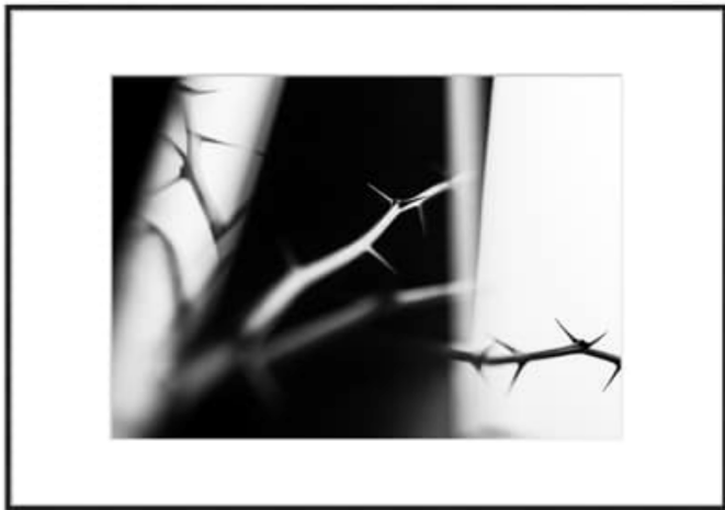
Sans Titre 01, series Optique 70 x 50 cm (Avec cadre: 100 x 70 cm) Edition de 10 plus 2 épreuves d'artiste (tous formats confondus). Chaque photo est numérotée, signée et livrée avec un certificat d'authenticité Hahnemühle. Tirages Fine Art réalisés sur papier Hahnemühle